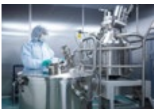
Kemia ja petrokemia