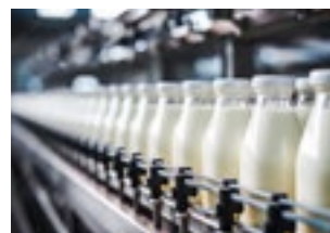
Elintarvike- ja juomateollisuus